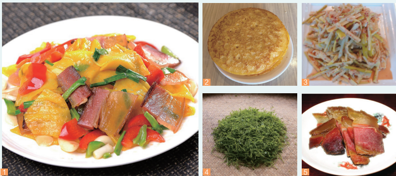
1. 鸡蛋皮子炒腊肉 2. 浆耙馍 3. 腐乳拌鲜竹笋 4. 绞股蓝 5. 砧板肉