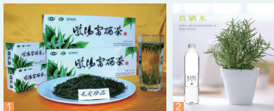
1. 紫阳富硒茶 2. 紫阳真硒水