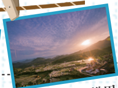
汉阴凤堰古梯田 移民生态博物馆