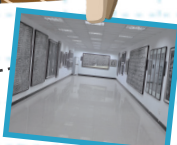
安康藏一角博物馆