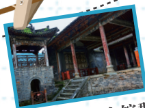
紫阳瓦房店会馆群